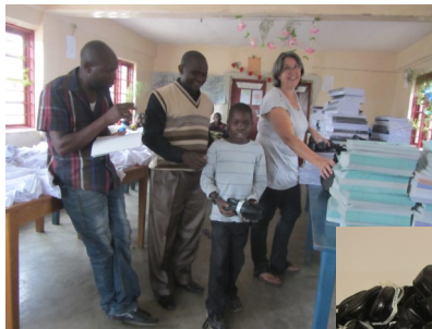
Beim Verteilen der Schulhefte, Schuhe und Uniformen